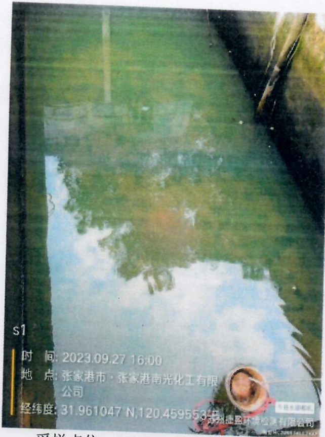
采样点位: DW002 雨水总排口 S1